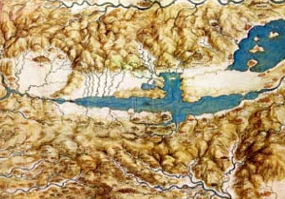
Val di Chiana. Leonardo Da Vinci (1503), Windsor Castle, Royal Library n. 12278