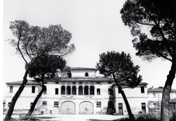
Podere Esesecco - Località Bettolle - Valdichiana

La Razza ha avuto origine nella Valle da cui prende il nome: la Valdichiana. Con il nome di Valdichiana si chiama la piana che si sviluppa nella Toscana più meridionale, compresa nelle provincie di Siena, di Arezzo e per breve tratto in quella di Perugia. Per molti anni è stata una terra ostile a causa di un impaludamento molto esteso, ma grazie a un'azione di bonifica, completata nel XVIII secolo, è tornata ad essere una terra molto fertile.