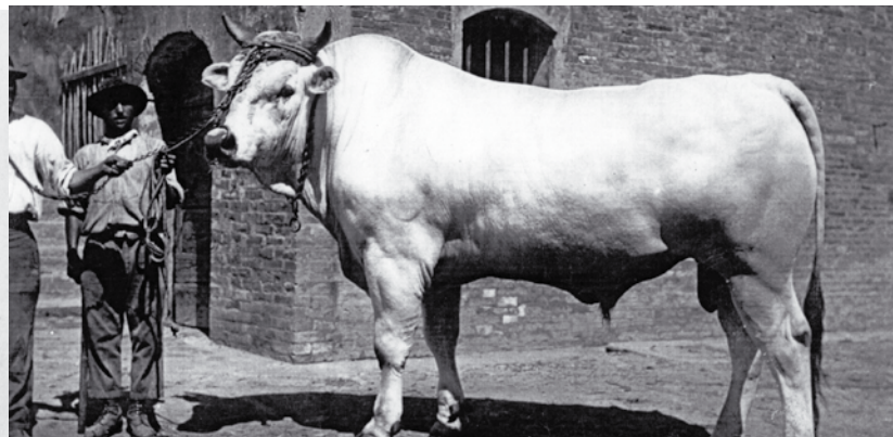
Toro Banino, 1934 - Fattoria Passerini - Bettolle (Siena)