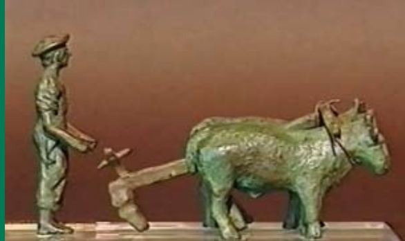
Bronzetto di Arezzo, 400 a.C.

“The Valley of the White Giant” is a project for the development of the Chianina breed and its area of origin: the Valdichiana, the Chiana Valley the valley that gave birth to an event of historical cultural on the Chianina breed, with particular regard to its link with the area of origin, the Val di Chiana and its culinary uses; an opportunity to raise awareness of the history of this wonderful animal. An opportunity to understand the future of the world’s largest cattle with its noble appearance, its purity and the whiteness of its coat and therefore called “The White Giant”. Considering that the Chianina is the symbol of our country in the world, we feel obliged to work to make known to future generations the quality of this animal whose history is intertwined with our origins.