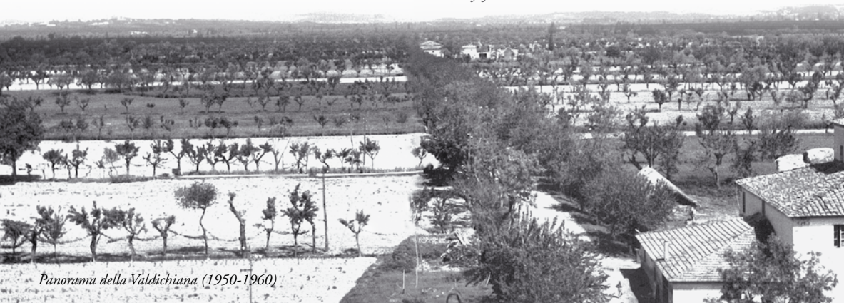
Panorama della Valdichiana (1950-1960)

The Chianina had origins in the valley from which takes its name: the Valdichiana, the Chiana Valley. The plain that develops in the southern part of Tuscany, in the provinces of Siena, Arezzo and for a small part in the province of Perugia, is called Valdichiana. For many years it was a hostile land due to a very large waterlogging, but thanks to a good drainage, completed in the 18th century it returned to be a very fertile land.