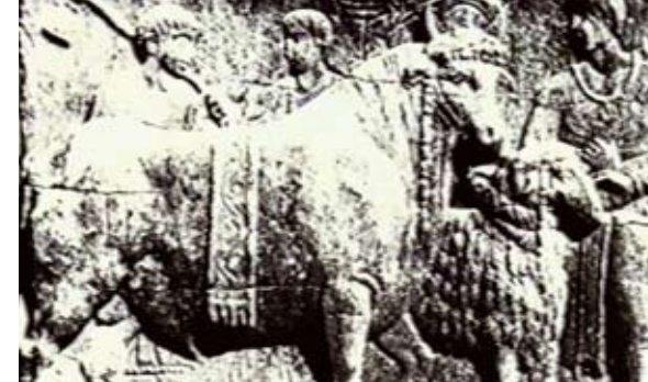
Base della colonna dei Cesari nel Foro romano, 303 d.C. (particolare)